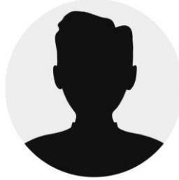
Nail GÜL Din Kültürü ve Ahlak Bilgisi